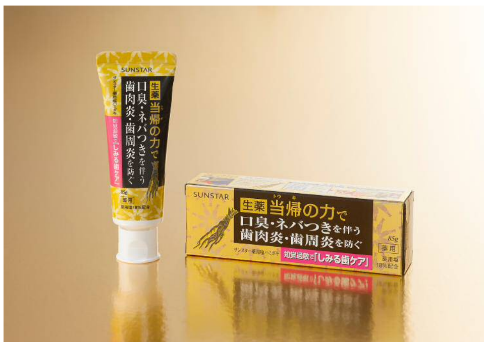
サンスター薬用塩ハミガキ しみる歯ケア

サンスターグループ オーラルケアカンパニーは、炎症抑制作用がある「生薬当帰（トウキ）エキス」をはじめとする薬用成分がバランス良く働き、口臭やネバつきを伴う歯肉炎・歯周炎を予防する「サンスター薬用塩ハミガキ」に、知覚過敏症状により歯がしみるのを防ぐ成分を加えた「サンスター薬用塩ハミガキ しみる歯ケア」を追加。2017年9月25日（月）より全国で発売いたします。