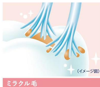
図2) ミラクル毛の細かい毛先がやさしく汚れをからめとる