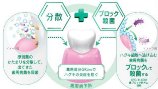
図 1 新 W アプローチ 菌のかたまり分散 + ブロック殺菌、さらに抗炎症作用で歯周病を防ぐ