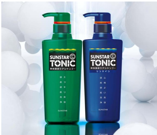
サンスタートニック爽快頭皮ケアシャンプー（左）