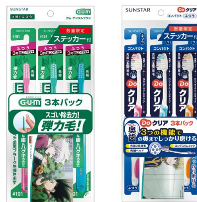
ステッカー入りハブラシ3本パック