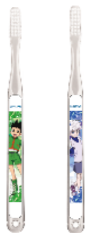
左：ゴンオリジナルハブラシ 右：キルアオリジナルハブラシ