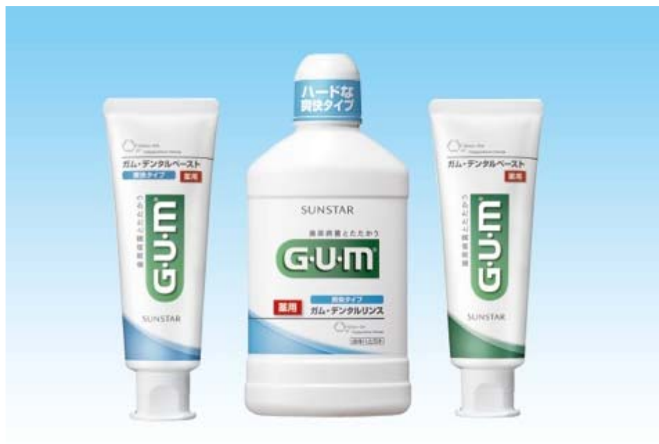
ガム・デンタルペースト 爽快タイプ

トータルケアで歯周病菌とたたかう「G·U·M」として、より効果的な歯周病対策のためにラインナップを拡充します。