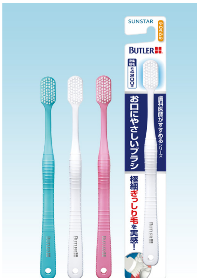
「バトラー お口にやさしいブラシ」

サンスター株式会社（本社：大阪府高槻市、代表取締役社長 吉岡貴司、以下サンスター）は、歯科医師がすすめるブラシシリーズとして、幅広ヘッドと約 4,200 本の極細ぎっしり毛（密集植毛）で、みがきたいところにあてやすく、やさしいタッチでみがくことができる「バトラー お口にやさしいブラシ」を 2015 年 3 月 16 日（月）より全国で発売いたします。自分自身で細かく丁寧にみがくことができない方でも使いやすい設計で、歯とハグキをやさしくみがきあげます。