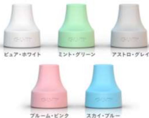
ガム・プレイ カラーキャップ (交換用別売品)