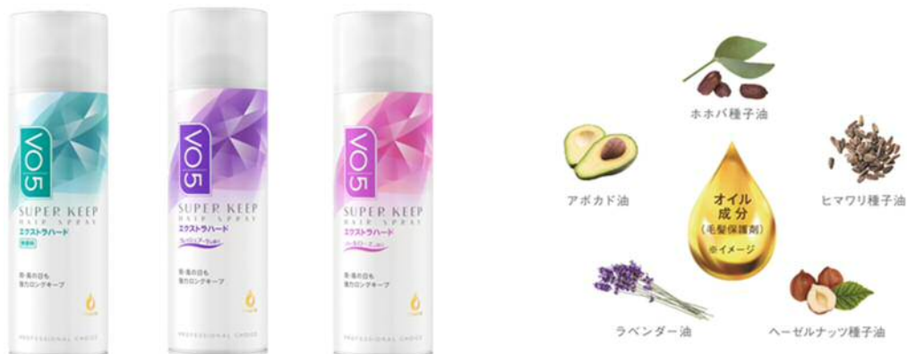
図4：VO5スーパーキープヘアスプレー＜エクストラハード＞ 無香料（左）・フレッシュブーケの香り（中央）・パールローズの香り（右）

*1ホホバ種子油、ヒマワリ種子油、アボカド油、ヘーゼルナッツ種子油、ラベンダー油