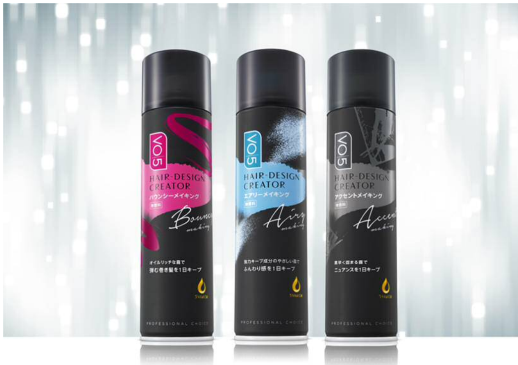
VO5ヘアデザインクリエイター <バウンシーメイキング>無香料（左） <エアリーメイキング>無香料（中央） <アクセントメイキング>無香料（右）

ふんわり感をつくる「エアリーメイキング」、ゆる巻きをつくる「バウンシーメイキング」、ポイントの立体感やニュアンスをつくる「アクセントメイキング」の3タイプのラインアップです。