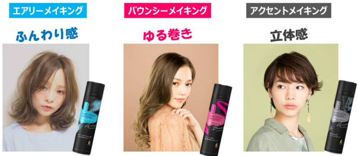
図1：VO5ヘアデザインクリエイターのラインアップ

しかしヌケ感ヘアは、ワックスやムースでは重みが出てしまい軽やかに仕上がりにません。また、スタイリング剤を何もつけないと一日キープできません。一方、プロのヘアスタイリストは、ヘアスプレーを上手く使い、ドライな質感を活かすことによりヌケ感ヘアをつくっています。このプロのスタイリングテクニックをヒントに、女性が自分でも簡単に、サロン帰りのような自然で軽いヌケ感ヘアを再現することができる霧状スタイリング剤を開発しました。（図1）