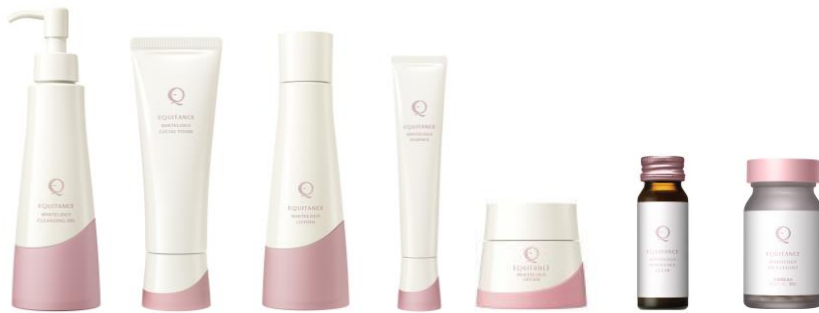
エクイタンス ホワイトロジー シリーズ

「EQUITANCE (エクイタンス)」は今後、様々な役割を担いながら社会で輝く女性に向けて、身体や肌だけでなく、内面からも健やかで美しい状態へ導く商品、サービスを提供いたします。