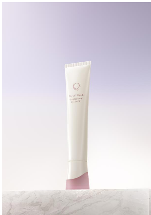
エクイタンス ホワイトロジー エッセンス