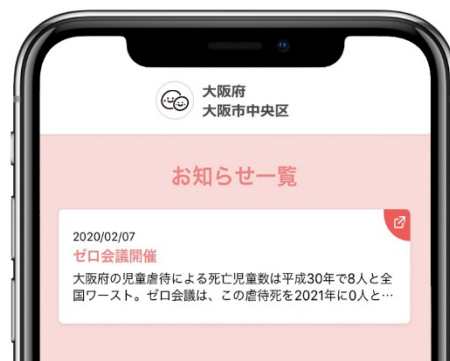
プッシュ機能によるお知らせ通知画面